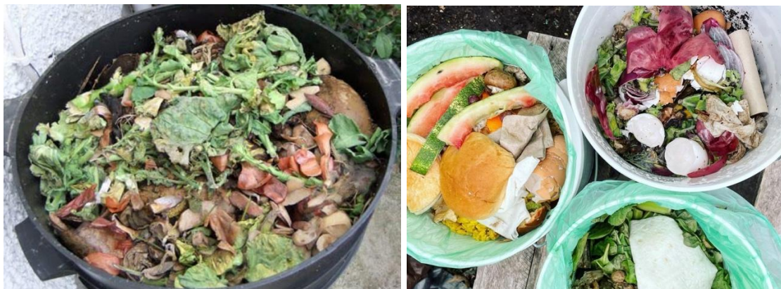
Gambar 2. Kegiatan Pemilahan Sampah Organik oleh Masyarakat Desa Kertosono.

Kegiatan pengabdian berupa pendampingan pembuatan pupuk kompos dengan menggunakan drum komposter di Desa Kertosono, Gresik berlangsung lancar sesuai dengan tahapan yang telah disusun, meliputi sosialisasi awal, pelatihan praktik teknis, serta tahap monitoring dan evaluasi. Keterlibatan warga sudah terlihat sejak awal kegiatan, khususnya pada saat penyampaian materi dan praktik pengisian komposter. Minat warga semakin tinggi ketika proses pengomposan dilakukan secara langsung menggunakan bahan-bahan yang berasal dari limbah rumah tangga sehari-hari. Melalui metode pendampingan, masyarakat tidak hanya mendapatkan pengetahuan secara teori, tetapi juga ikut terlibat secara aktif dalam setiap tahap kegiatan. Kondisi ini membantu memperdalam pemahaman warga mengenai teknik pengomposan sekaligus menumbuhkan rasa memiliki terhadap teknologi yang diperkenalkan. Salah satu aktivitas pendampingan memilah organik berupa dedaunan kering dan sayuran dapat dilihat pada gambar 2 berikut.