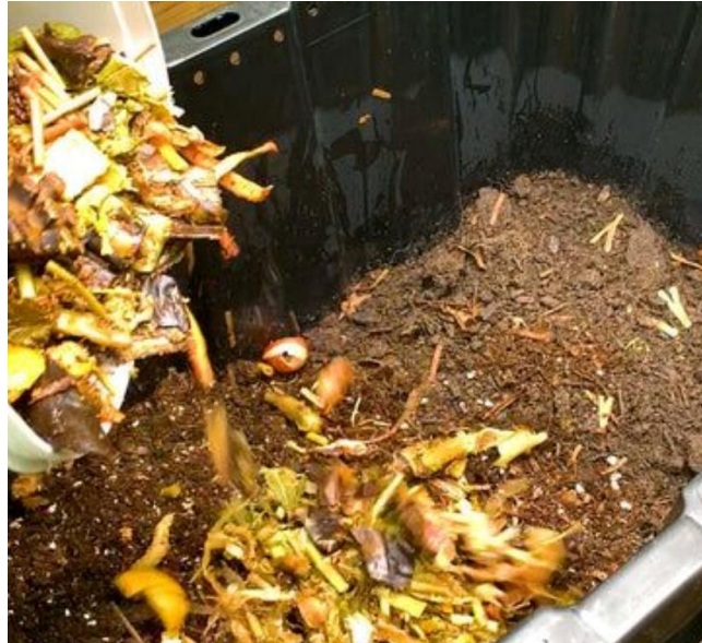
Gambar 3. Proses pengomposan dengan menggunakan sampah organik.

langsung mengenai pentingnya menjaga keseimbangan antara bahan basah dan bahan kering, serta ketepatan dalam penggunaan aktivator. Metode praktik langsung ini dinilai efektif dalam meningkatkan keterampilan dan kemandirian warga dalam mengelola sampah organik. Proses pengomposan dengan menuangkan sampah organik ke atas tanah untuk dijadikan pupuk ini dapat dilihat pada Gambar 3.