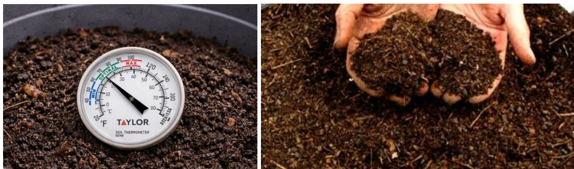
Gambar 4. Pengontrolan Suhu dan Kondisi Kompos Setelah \pm 30 hari.