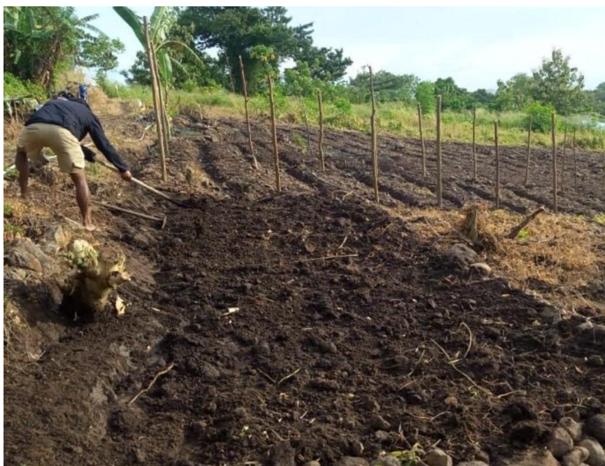
Gambar 5. Lahan Fasum Yang Memanfaatkan Hasil Dari Proses Pengomposan Sistem Drum Komposter

Pupuk kompos padat dan cair kemudian diaplikasikan pada tanaman hortikultura yang ada di fasilitas umum milik warga sehingga terlihat secara nyata manfaat dari kegiatan ini. Lahan fasum yang memanfaatkan hasil pengomposan dengan sistem drum komposter dapat dilihat pada Gambar 5.